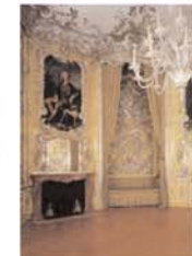
nischen in der amalienburg